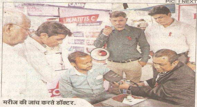
मरीज की जांच करते डॉक्टर.