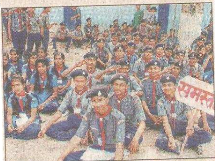
Students take part in the HIV awareness programme on Tuesday.